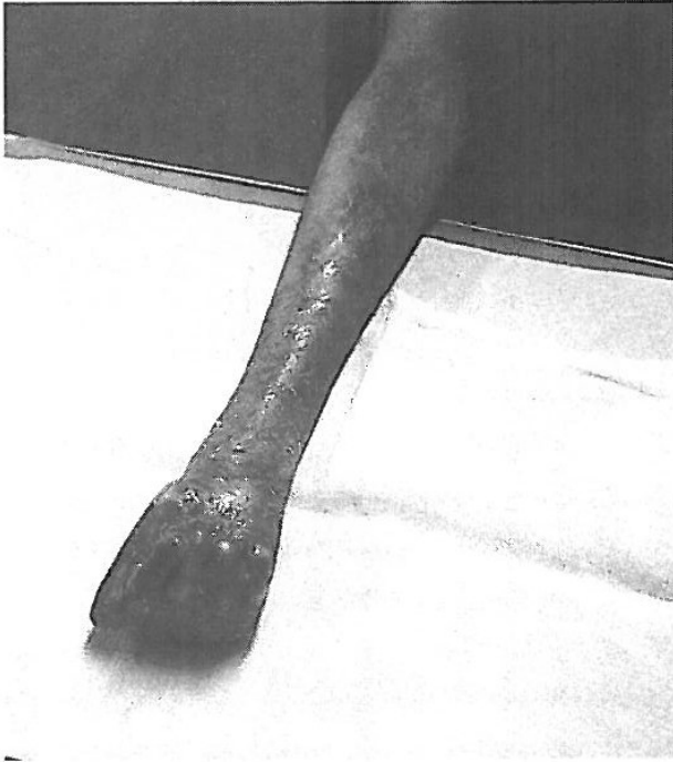
FIG. 2. Aspecto físico de la mano derecha no intervenida quirúrgicamente.

están afectados, cabe presuponer que el tratamiento general debe comenzar desde etapas muy tempranas de la vida y mantenerse de forma continuada a lo largo del tiempo, pues se considera que un abandono en el mismo llevaría, con toda seguridad, a la muerte del paciente, ya que las infecciones repetidas, la desnutrición, la aparición de carcinomas en lugares de la piel con lesiones crónicas, etc., serían inevitables.