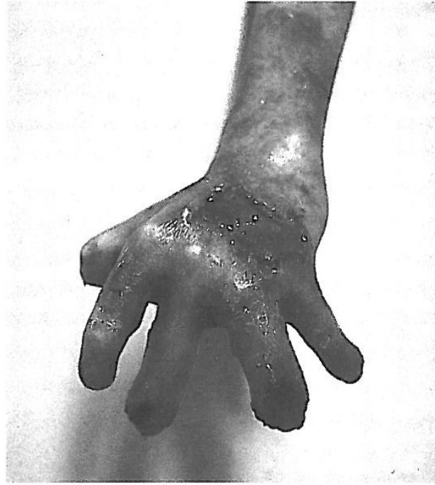
FIG. 5. Aspecto físico de la mano izquierda intervenida después de 15 días de tratamiento fisioterapéutico.

jar pasivamente con ellos, realizando movilizaciones de las diferentes articulaciones o cualquier otra maniobra, hay que tener en cuenta este hecho, ya que el roce continuado de nuestras manos sobre su piel va a estimular, con toda seguridad, la aparición de una ampolla, la cual, a su vez, nos va a impedir, en sesiones posteriores, continuar con el tratamiento en ese mismo lugar.