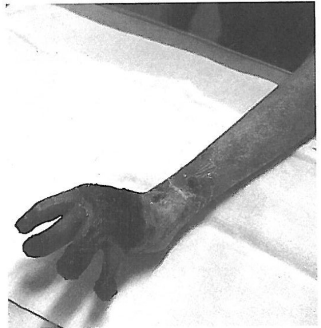
FIG. 3. Aspecto físico de la mano izquierda intervenida quirúrgicamente.

La utilidad de este tipo de cirugía ha sido puesta en duda por muchos autores, ya que, una vez hecha y a lo largo del tiempo, la mano vuelve a cerrarse, haciéndose necesaria una nueva intervención. El caso que estamos estudiando ha requerido hasta ahora dos intervenciones en cada mano. En la última se le han implantado una serie de agujas, que van desde la parte más distal de cada uno de los dedos al carpo, para asegurar así la extensión completa de las manos, en cuyas palmas se han implantado también sendos injertos.