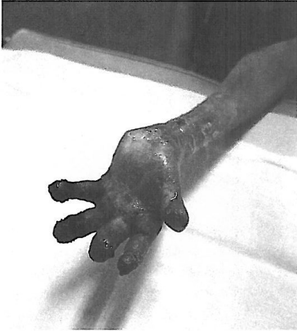
FIG. 4. Aspecto físico de la mano izquierda intervenida quirúrgicamente.