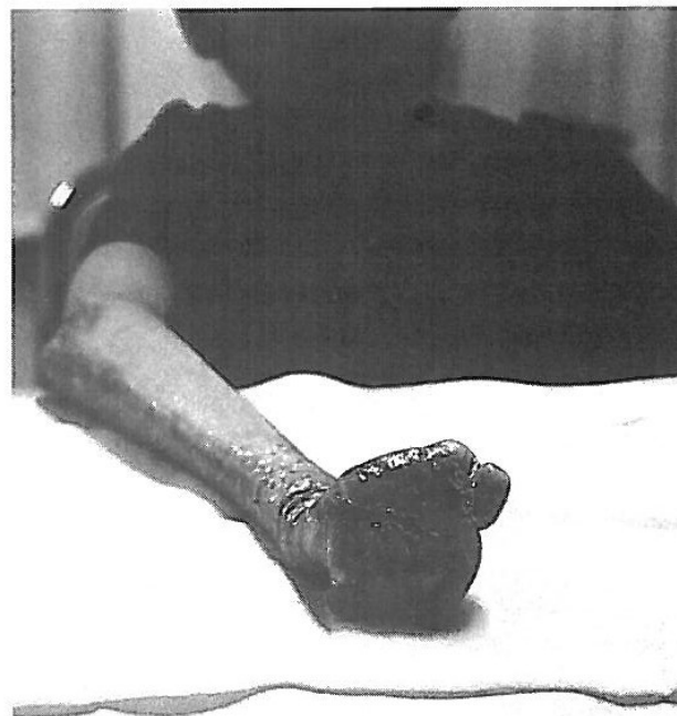
FIG. 1. Aspecto físico de la mano derecha no intervenida quirúrgicamente.

Existe también una minoría de pacientes que siguen un patrón opuesto en la aparición de las ampollas, presentándose éstas en